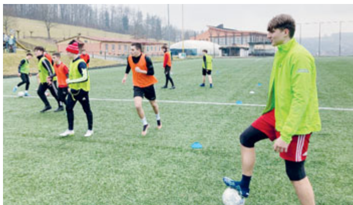
Dorost na soustředění v Luhačovicích

Co se týče samotných fotbalistů, ti se již nemohou dočkat začátku jarních soutěží. Pilně finišují se svou přípravou a ladí formu do jarních bojů. Všichni si zkusili nějaké přátelské zápasy, starší dorost absolvoval zimní soustředění, přípravky se zúčastnily turnajů pro své kategorie.