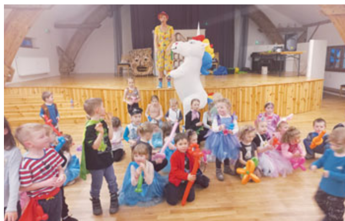
Pohádkový karneval 10. března na Sýpce