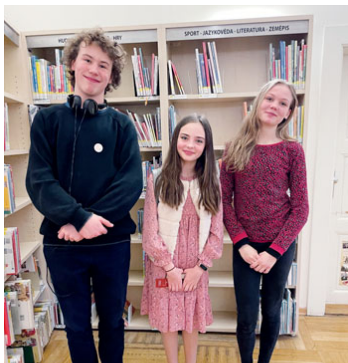
Výherci druhého stupně