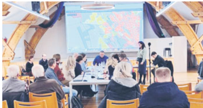
Debaty k územnímu plánu

Mezi nejrozšířenější plochy náleží BU bydlení všeobecné, BI bydlení individuální, SU smíšené obytné všeobecné, OV občanské vybavení veřejné, OK občanské vybavení komerční, OS občanské vybavení sport, VL výroba lehká, TU technická infrastruktura všeobecná, DU doprava všeobecná, ZU zeleň všeobecná, ZK zeleň krajinná, RX rekreace jiná, LU lesní všeobecné, AU zemědělské všeobecné a WU vodohospodářské všeobecné. Ke každému funkčnímu typu plochy je potom stanoveno, jak ji lze konkrétně využívat, resp. co je v daném místě přípustné a co ne.