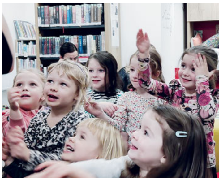
Nejmladší čtenáři z Bookstartu

V rámci projektu Bookstart jsem přivítala na akci maminky s těmi nejmenšími čtenářičky; povídali jsme si o emocích a hráli si s barvičkami.