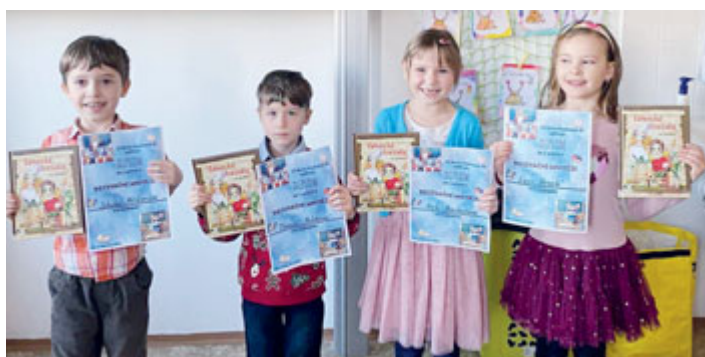
Výherci prvního stupně