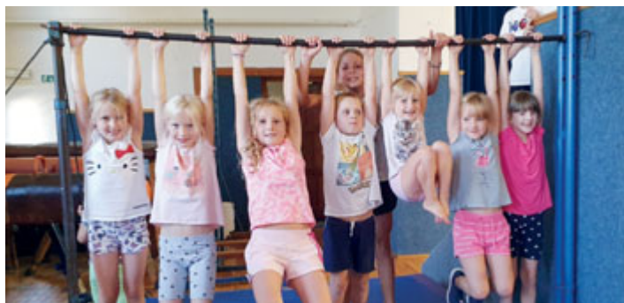
Oddíl všestrannosti v akci

I v druhém pololetí školního roku pokračujeme ve všech mládežnických oddílech TJ Sokol Medlány. Děti sportují v basketbalové přípravce, v oddílech všestrannosti a v oddílech florbalu.