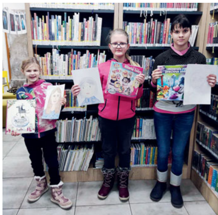
Vítězové výtvarné soutěže ze čtenářského kroužku

Děti ze čtenářského kroužku jsem přihlásila do výtvarné soutěže s názvem „Moje paní učitelka, můj pan učitel“. Zúčastnilo se celkem 52 výtvarných prací. Všechny děti z kroužku se umístily do dvacátého místa a ty nejšikovnější obsadily nádherné první, druhé a páté místo.