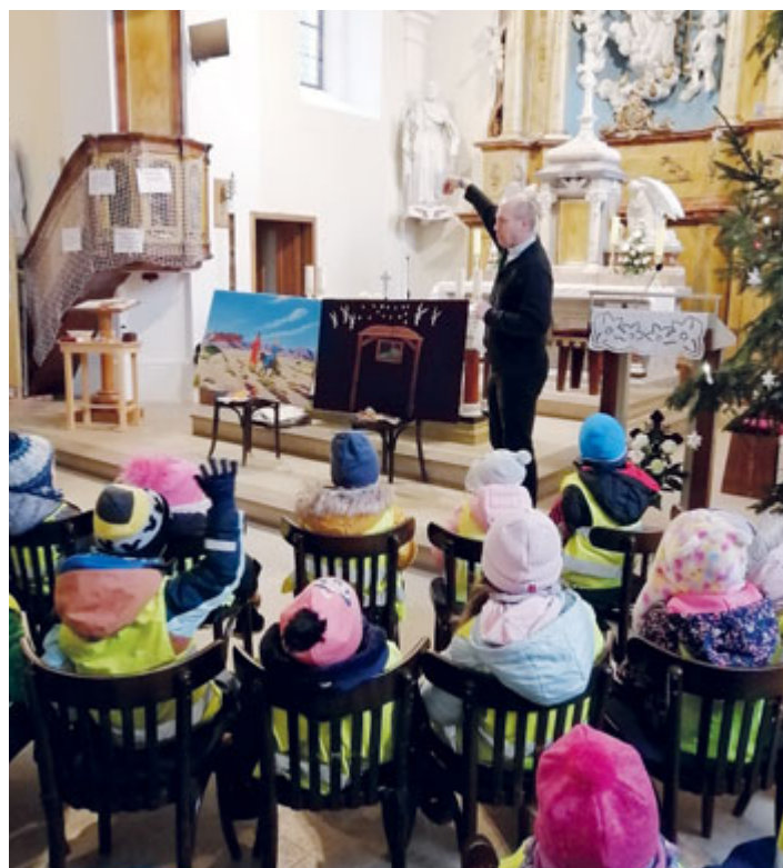
Povídání s panem farářem