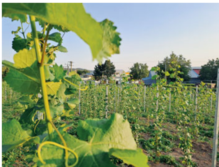
První rok medláneckého vinohradu

Rok 2024 bude prvním, kdy se o viniční trať V Pustých musíme celý rok starat. Hledáme proto nadšence, kteří budou s námi chodit na brigády a dělat vše co je na vinohradu v danou dobu potřeba. Brigády budou probíhat přibližně od konce dubna do konce září, jednou za 14 dní a budou většinou o víkend. Umět nic nemusíte, vše rádi vysvětlíme. Na brigádách je vždycky o zábavu a pitný režim postaráno:) Pokud se chcete k nám připojit, tak napište na medlaneckyyvinohrad@seznam.cz nebo pište/volejte na 608 052 072 a hlavně sledujte naši skupinu na Facebooku Medlánecký vinohrad.