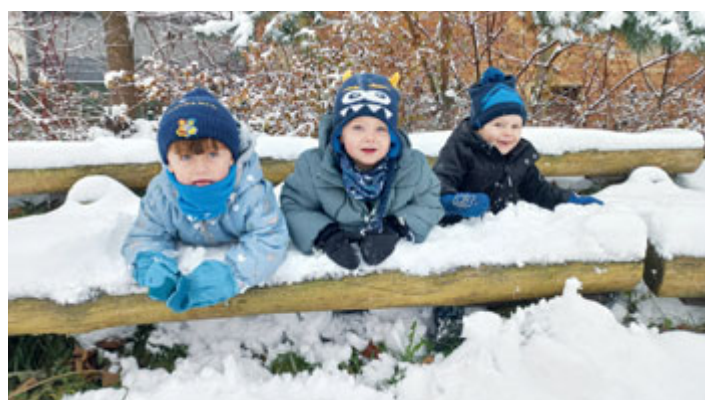
Řádíme na zahradě Jabloňky